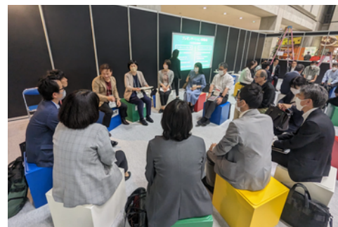
教育委員会向け研修・交流会