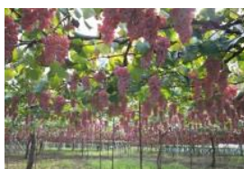
日本一の生産量を誇る棚式栽培による ブドウ畑