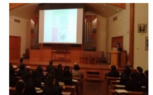
ユネスコスクール