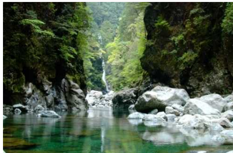
大杉谷峡谷シシ淵