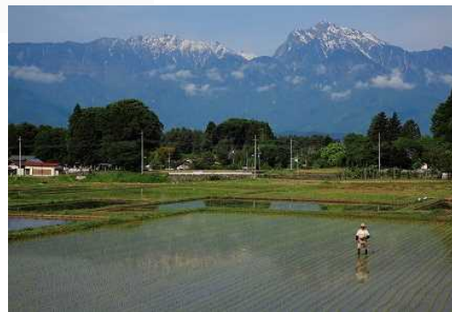
甲斐駒ヶ岳と水田