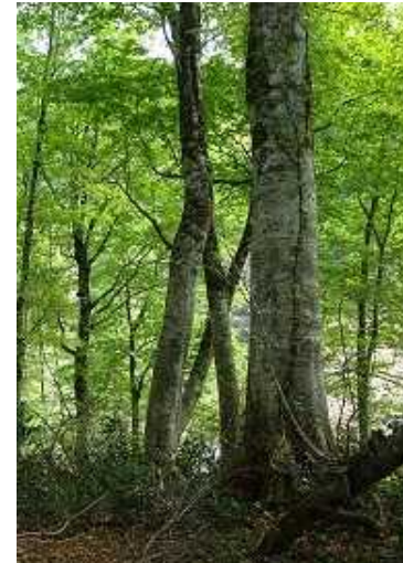
ブナ天然林