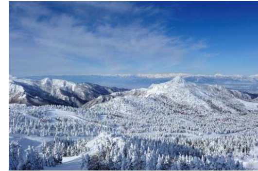
志賀高原