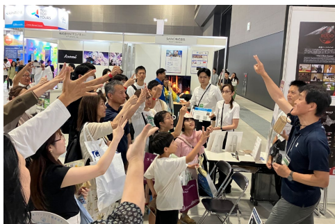
事業者プレゼンテーションの様子