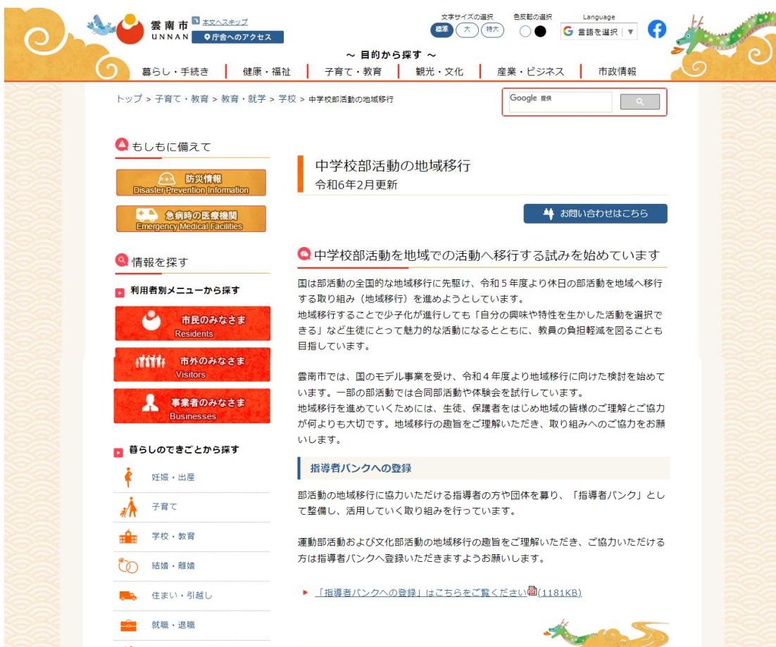
【雲南市HP「中学校部活動の地域移行」】