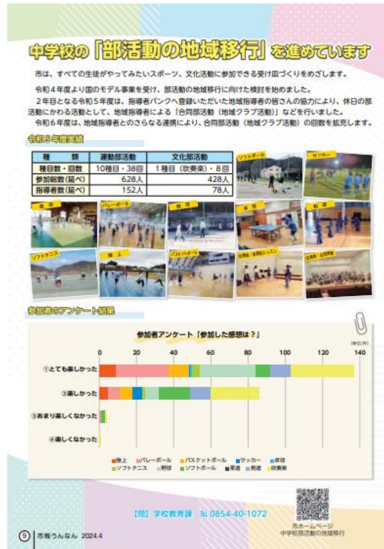
【雲南市広報誌2024. 4月号】