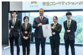
令和5年度 長官賞（アイデア部門） 九州共立大学