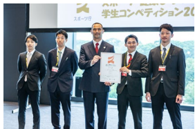
令和5年度 長官賞（デザイン部門） 関西大学大学院