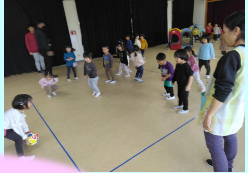
「転がしドッジボール」