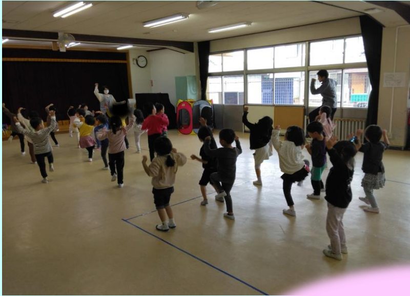
「足が速くなる魔法のダンス」