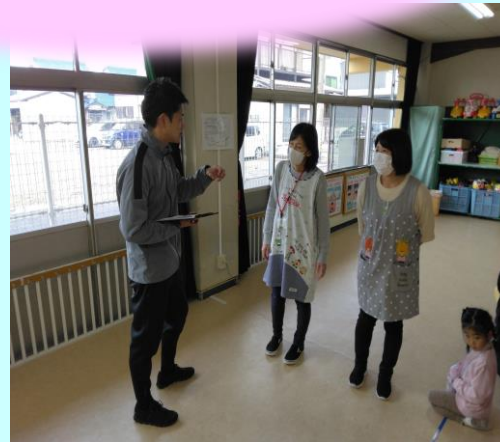
「大学教員による園指導者への助言・指導」