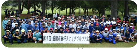
笠間市長杯スナッグゴルフ大会