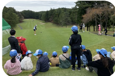
課外授業として、プロゴルフツアー見学