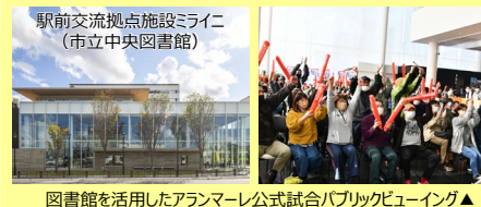
駅前交流拠点施設ミライニ（市立中央図書館） 図書館を活用したアランマーレ公式試合パブリックビューイング▲