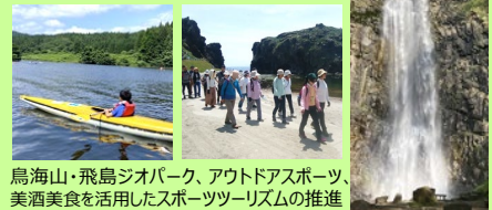
鳥海山・飛鳥ジオパーク、アウトドアスポーツ、美酒美食を活用したスポーツツーリズムの推進