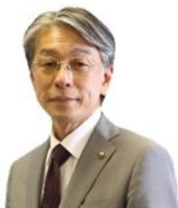
田辺市長 真砂 充敏 氏