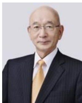
萩市長 田中 文夫 氏