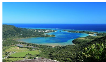
<ぶざま岳から望む川平湾>