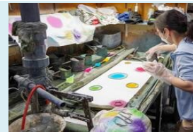
＜ファクトリズム散走 染物体験＞