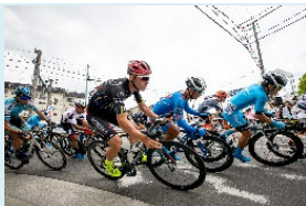
＜ツアー・オブ・ジャパン堺ステージ＞