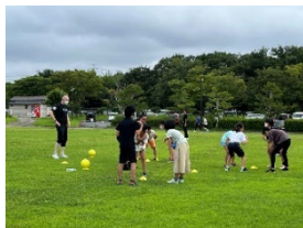
<English Sports Camp>