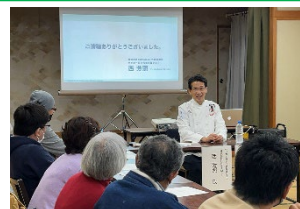
<宿泊事業者向けセミナー>