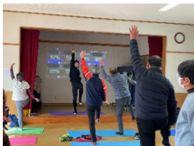
<高齢者向けヘルスケア>