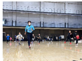
<みはまスポーツフェスティバル>