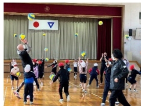
<スポーツ×英語教育>