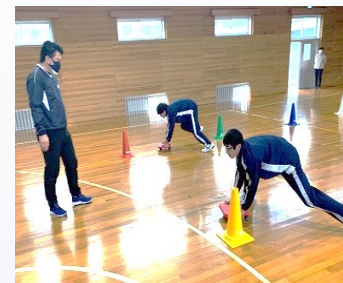
〈体幹トレーニング〉