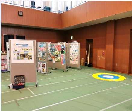
体験コーナーを設置