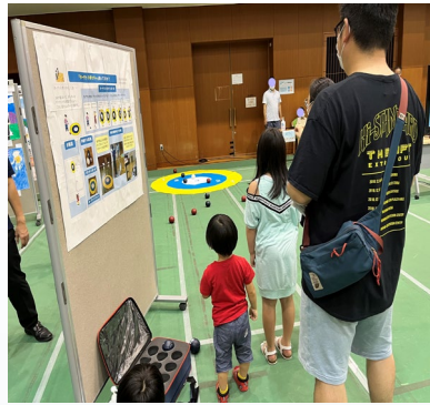
体験コーナーの様子