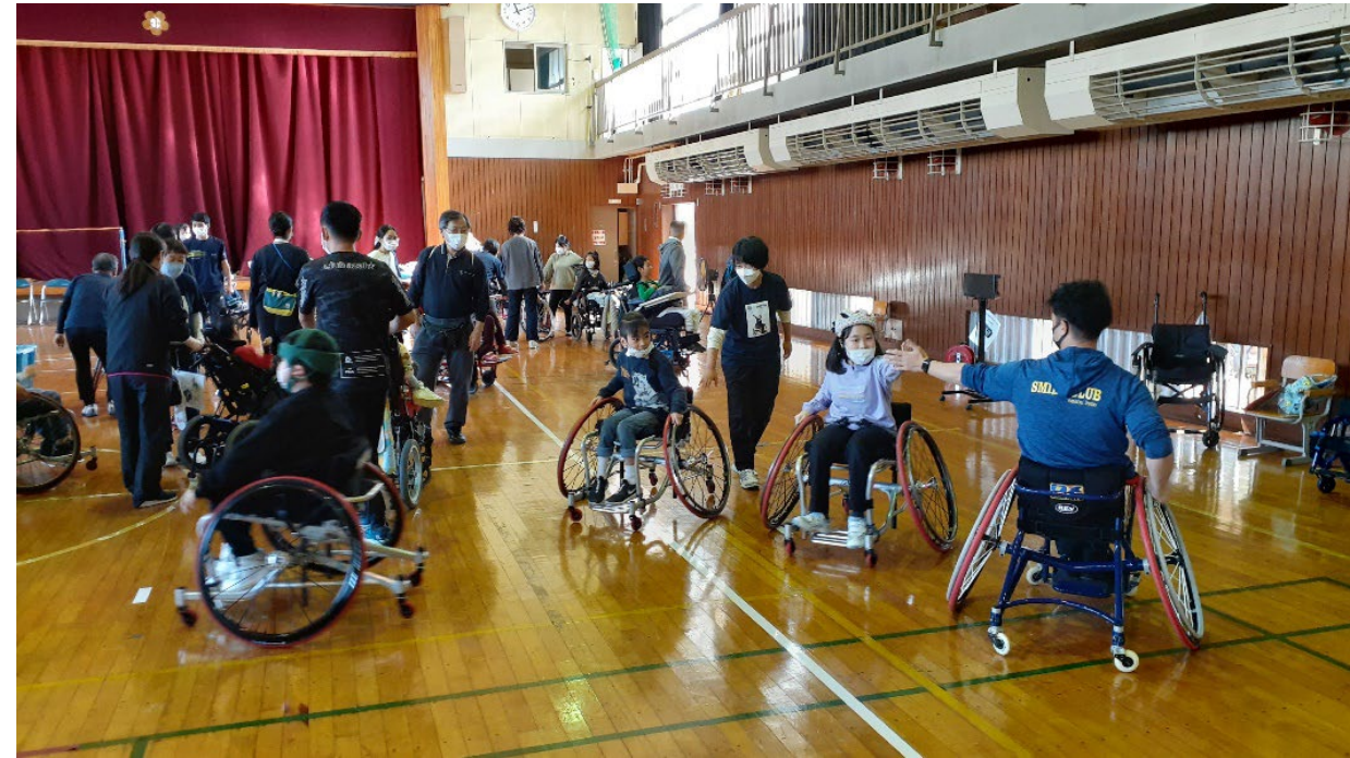
実際のパラバドミントンを見て（左）、乗っての体験（右）