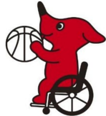
千葉県マスコットキャラクターチーバくん