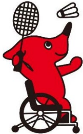
千葉県マスコットキャラクターチーバくん