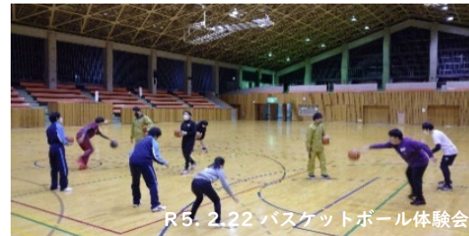
R5.2.22 バスケットボール体験会