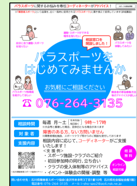
&lt;相談窓口開設 チラシ&gt;