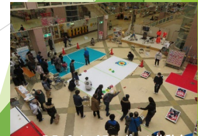
R5.2.4 パラスポーツ体験会