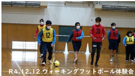
R4.12.12 ウォーキングフットボール体験会