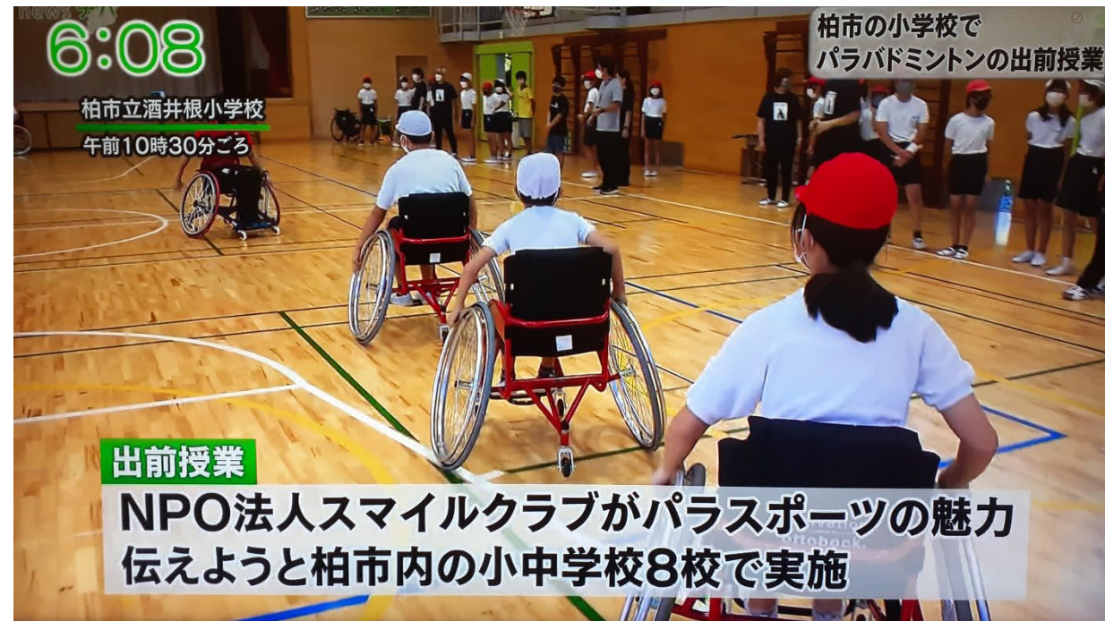
参加者全員が競技用車いすを体験！