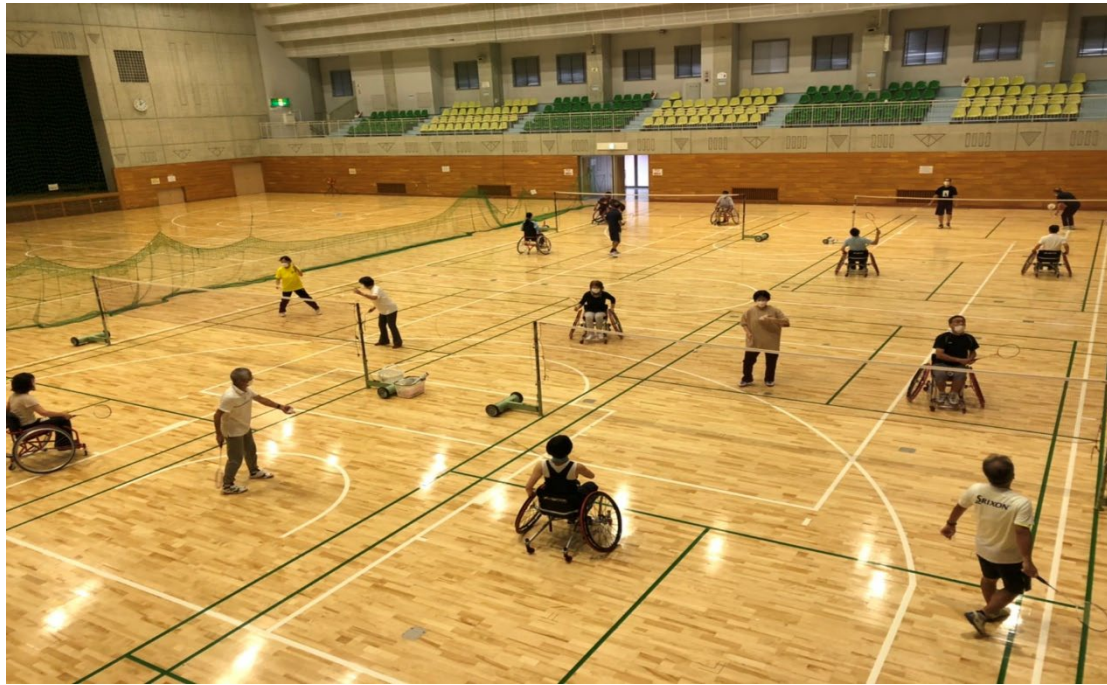
実際に乗ってパラバドミントンを体験