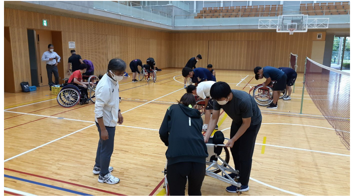
まずは、競技用車いすの組み立て