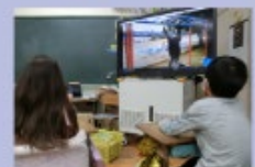
動画を作成して紹介