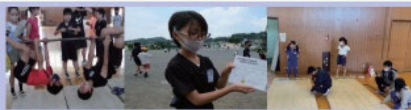
鉄棒ウィーク、外で遊ぼうウィークなどの児童主体の限定企画をどしどし企画！