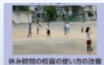
休み時間の校庭の使い方の改善 様々なボールの貸出で遊びの拡充