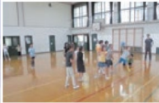
児童が遊び方を紹介し、ともに遊ぶ