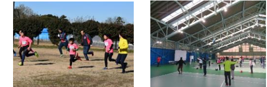
オリンピックによるランニング教室 企業・地域が連携した多世代運動会

● インナー事業の事例： 地域コミュニティの活性化を図る「 交流イベント・スポーツインライフの推進 」