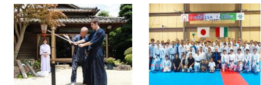
日本発祥の武道をコンテンツ化 ホストタウンのレガシー化

● アウトター事業の事例： 恒常的なスポーツ誘客が可能な「 通期・通年型スポーツアクティビティの創出 」