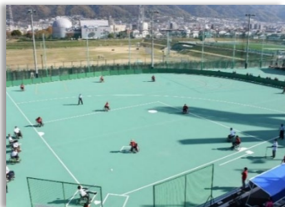
ウィルチェアスポーツコート

聖地花園の東側に日本初となる屋外型ウィルチェアスポーツ施設を設置し、定期的な体験会の実施や著名な選手を招待した情報発信等の取組を実施する。