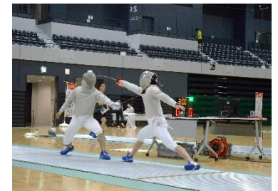
フェンシング日本代表サーブル種目 による東京オリンピック事前合宿の 様子