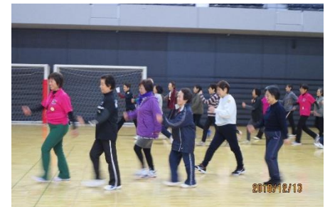
インターバル 速歩の様子