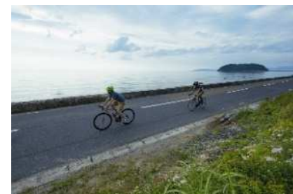
スポーツコンテンツの情報発信