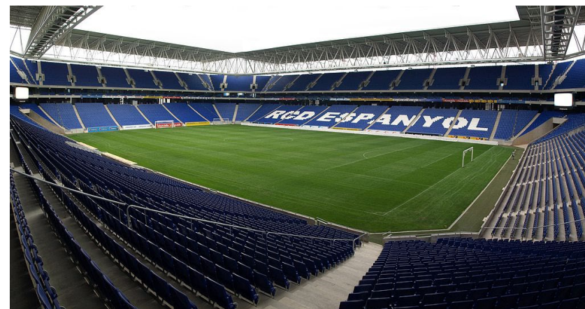
スタジアム内部全景