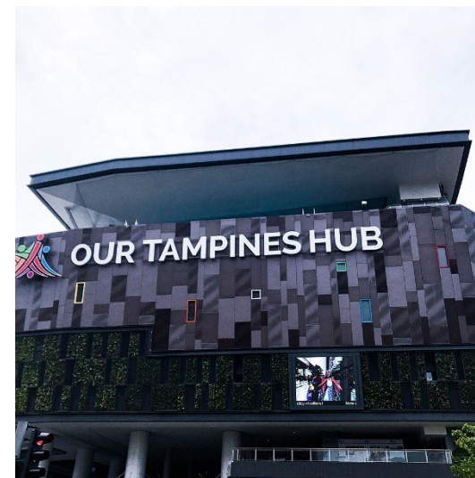
スタジアムの外観