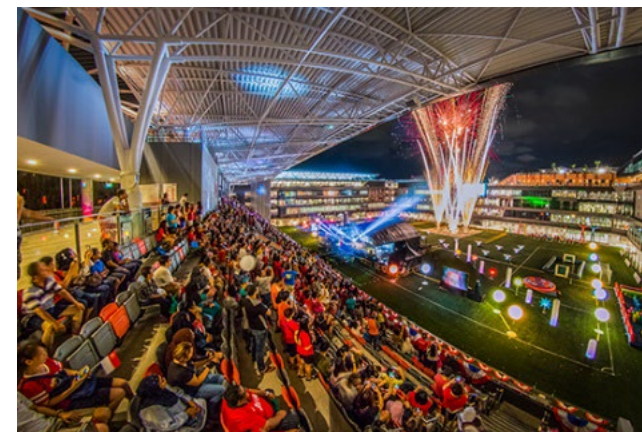
フィールドでのイベント