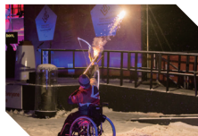
平昌2018大会ストーク・マンデビルでの採火※ Photo by Matt Fowler Photography on behalf of Aylesbury Vale District Council

A2 地域の特ちょうにあった様々な方法で炎が灯されます。デジタルの炎でもOKです。※パラリンピックの原点にちなんだアーチェリーの演出