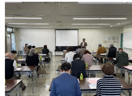
[熱心に聴講する参加者]