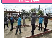
高齢者健康づくり教室