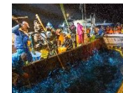
ほたるいか海上観光(4～5月)