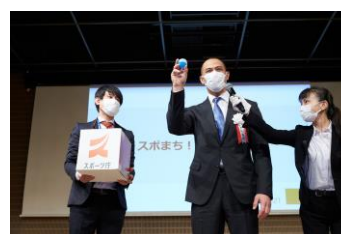
スポまち！ピックアップ