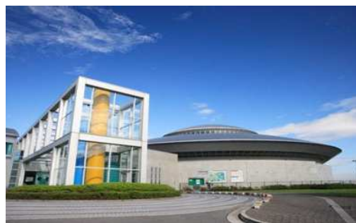
ひまわりドーム外観