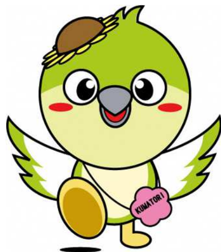
熊取町マスコットキャラクター 「メジーナちゃん」