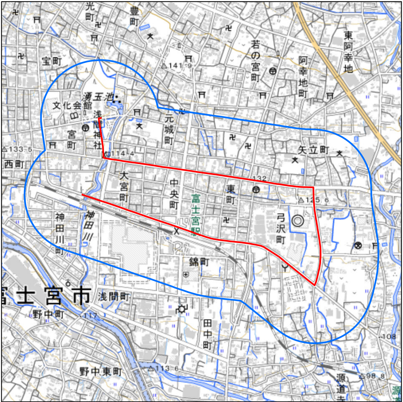
対象大会関係施設の区域