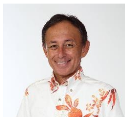
沖縄県知事 玉城 デニー 氏

今回、スポーツ・健康まちづくり優良自治体表彰2021において「沖縄空手振興ビジョン」及び「沖縄空手振興ビジョンロードマップ」に基づく取組が表彰されることを大変喜ばしく思います。ビジョンの基本理念で定めた「保存・継承」、「普及・啓発」、「振興・発展」の3つのキーワードのもとに、沖縄の伝統文化である空手の価値を県民のみならず世界の人々が再認識するとともに、「空手発祥の地・沖縄」の認知度向上及びブランディングを図ります。