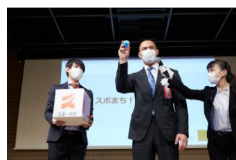
スポまち！ピックアップ