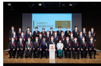
フォトセッションの様子