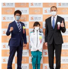
フォトセッション