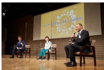
トークセッションの様子

「スポまち！長官表彰2021」では、表彰式のほか、特別ゲストを迎え、室伏広治スポーツ庁長官とのスポーツによる「まちづくり」トークセッションを行うなど、今後の全国でのスポーツによる地方創生、まちづくりの端緒を開きました。