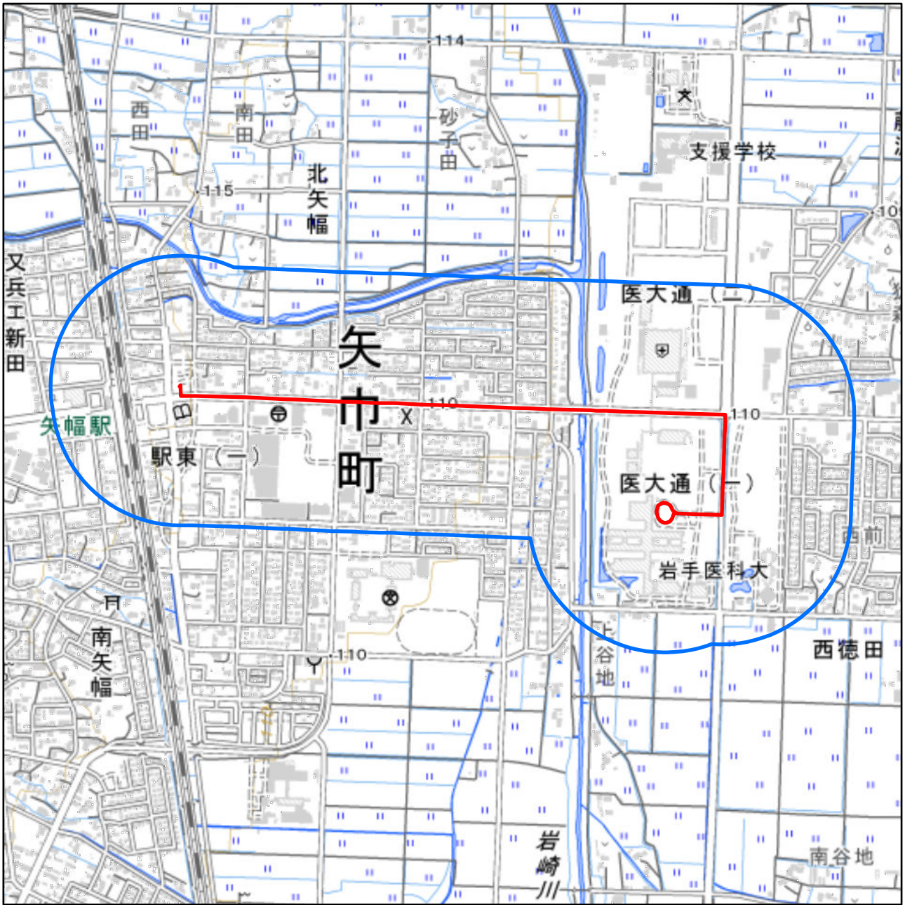
対象大会関係施設の区域