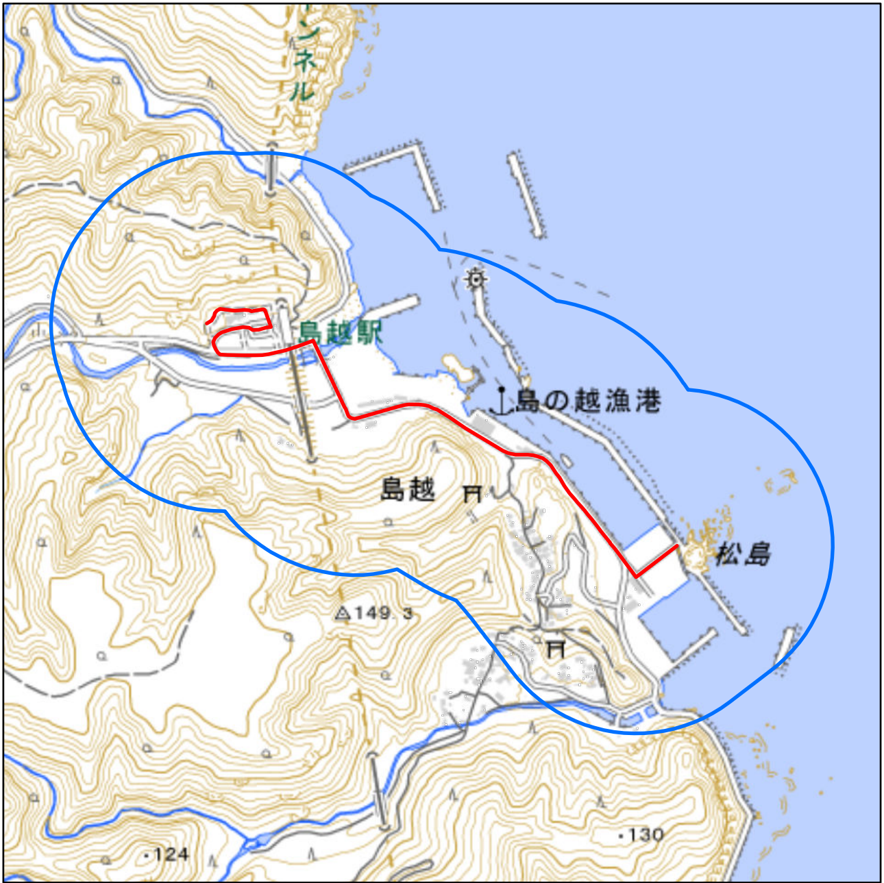
対象大会関係施設の区域