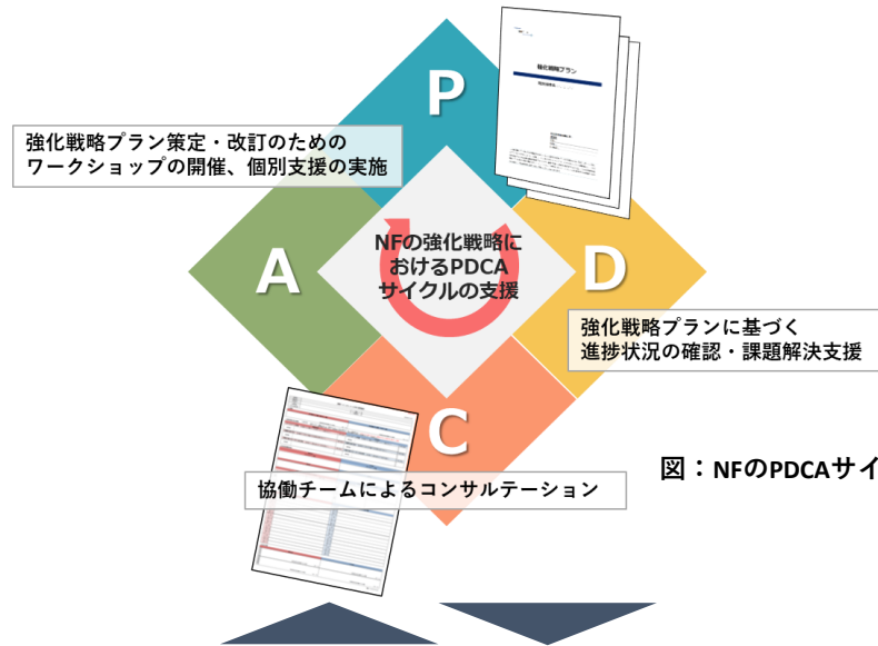
図：NFのPDCAサイクル各側面における支援活動