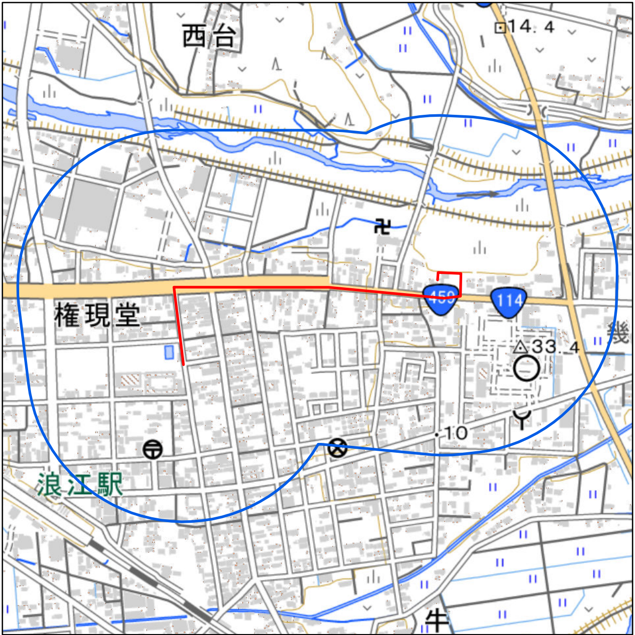
対象大会関係施設の区域