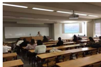
写真 学内説明会での様子