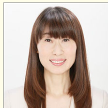
バスケットボール解説者/ 元バスケットボール女子日本代表 原田 裕花 氏