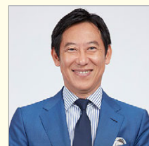
スポーツ庁長官 鈴木 大地

スポーツキャリアサポート戦略は、2020年東京オリンピック・パラリンピック競技大会に向け、国としてアスリートの競技力向上を推進している中、トップアスリートが安心してスポーツに専念できるよう、アスリートのキャリアについて、関係者が協働して効果的な支援を行うための仕組みを構築することを目指しています。本カンファレンスでは、「スポーツのチカラで未来を変える、Beyond2020 アスリートキャリア形成支援構想」を大きなテーマとして、アスリートキャリアの有識者・関係者、元アスリート、支援企業が集まり、今後のアスリートへの支援体制や、キャリア支援プログラムについて議論し、事業の推進を図ります。