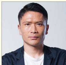
元サッカー日本代表 岩政 大樹 氏

基調講演の3名に加え、元アスリート、支援企業関係者が参加し、「アスリートに必要なと思われるキャリア支援プログラム」について議論し、今後の発展につなげます。