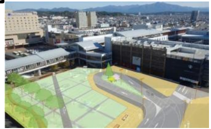
秋田駅西口駅前広場整備(南側) (秋田市) 2020年春竣工予定