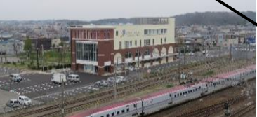
城東スポーツ整形クリニック 2018年5月開業 スポーツ・リハビリ機能