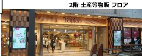
2階 土産等物販フロア