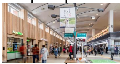
秋田駅観光拠点化リニューアル 2017年3月末完成