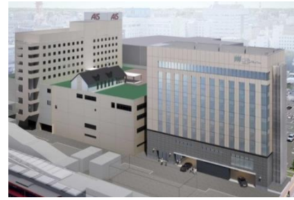
メトロポリタン秋田増築計画 2021年開業予定