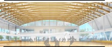
秋田ノーザンゲートスクエア 2019年冬完成予定【工事中】 アリーナ、子育て支援施設