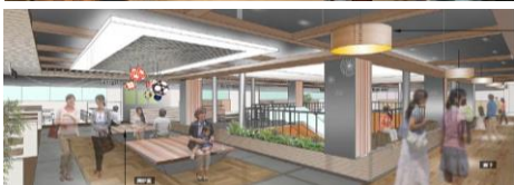
3階 レストランフロア