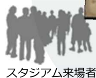
スタジアム来場者