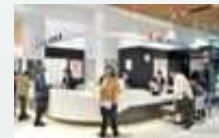
AEON インフォメーション カウンター

インフォメーションセンターで抽選券画像を 表示すると豪華景品が当たる抽選に参加可能