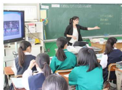
「I'm POSSIBLE」を活用した授業(中学校)

教材のダウンロードはこちら： https://education.tokyo2020.org/jp/teachers/texts/