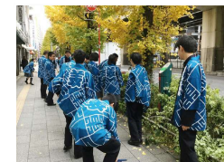
地域の清掃活動(高等学校)

東京2020大会をきっかけに地域社会での活動に関心を持っていただくために、児童・生徒によるボランティア体験や地域の清掃活動等への参加が行われています。