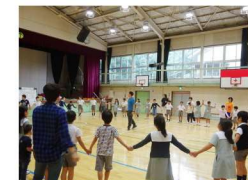
交流教室(特別支援学校)

様々な違いがあることを理解しつつ、共に生きていく力を身に付けるための活動です。小学生・中学生・高校生と特別支援学校/学級の児童・生徒との交流や、障がいのある方によるアート作品の鑑賞等を通して、多様性の理解を促進します。