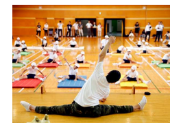
体操メダリストとの交流(小学校)

オリンピック・パラリンピアンを始めとしたアスリートとの交流により、努力や目標を持つことの大切さを学ぶことができるほか、競技の新たな魅力を発見することができます。また、スポーツ指導者等のアスリートを支える人々の存在を知ることができることは、キャリア教育の一助にもなります。