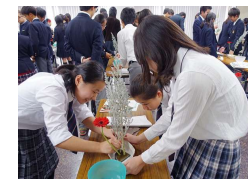
生け花教室(中等教育学校)

国際社会等で主体的に活躍できる人材となるために、伝統芸能の鑑賞や体験会等を通して、自国の伝統文化の魅力を学びます。