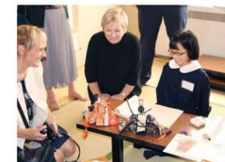
海外の方との交流(小学校)

世界中からアスリートと観客が訪れる東京2020大会に向けて、国際理解を促進する学習が行われています。既に事前キャンプ地等ではアスリートや競技関係者と児童・生徒との交流活動も始まっています。