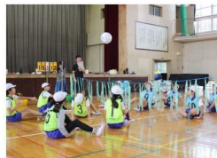
シッティングバレーボール体験(小学校)

体育の授業等を活用して新たな競技にチャレンジすることで、スポーツへの興味関心やチャレンジ精神を向上させることができます。東京2020組織委員会では、学校の授業以外でも子供たちに様々な競技を体験いただけるよう、競技体験イベントを開催しています。