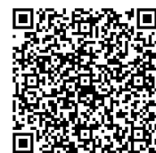
火山登山者向けの 情報提供ページ

(噴火速報の説明 : http://www.data.jma.go.jp/svd/vois/data/tokyo/STOCK/kaisetsu/funkasokuho/funkasokuho_toha.html )