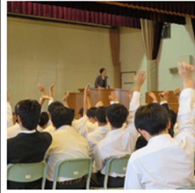
○健全育成推進会講演会の様子。 (ブラインドサッカーの紹介)