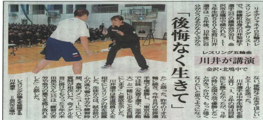
北国新聞 平成29年12月1日(金)