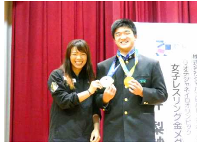
メダルをかけてもらった生徒