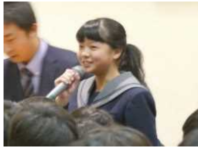
質問している生徒