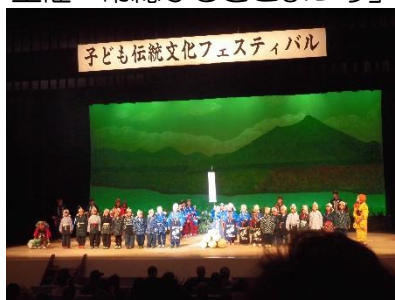
県主催「子ども伝統文化フェスティバル」 新聞報道