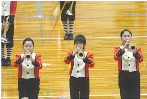
【ニューイヤーコンサート 1964東京オリンピックファンファーレ】