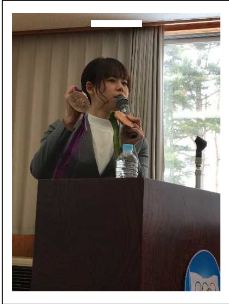
【 銅メダルを手にお話しされる星さん 】

1月30日(火) 5校時、オリンピックの星奈津美さんをお迎えし、「水泳が私に教えてくれたこと」と題して講演会を行った。