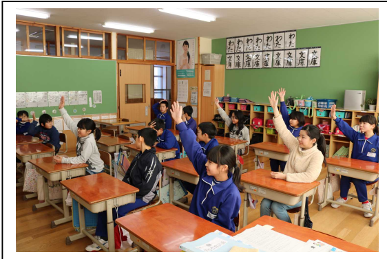
【 東京大会マスコットを検討中 】