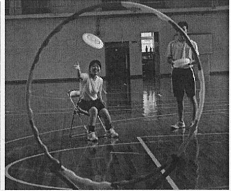
フライングディスク (いすに座って)