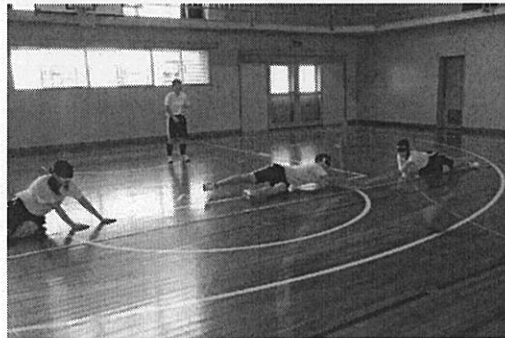
ゴールボール (アイマスク着用)