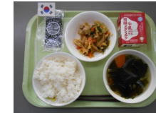
タッカルビ わかめスープ 韓国海苔