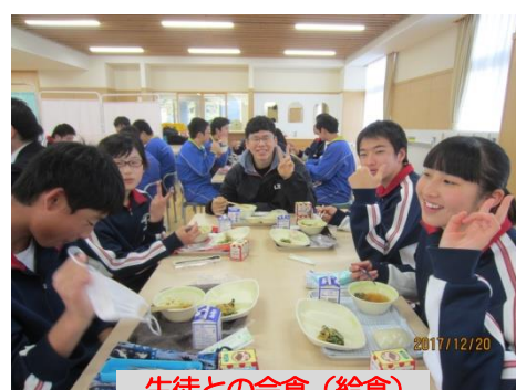
生徒との会食(給食)